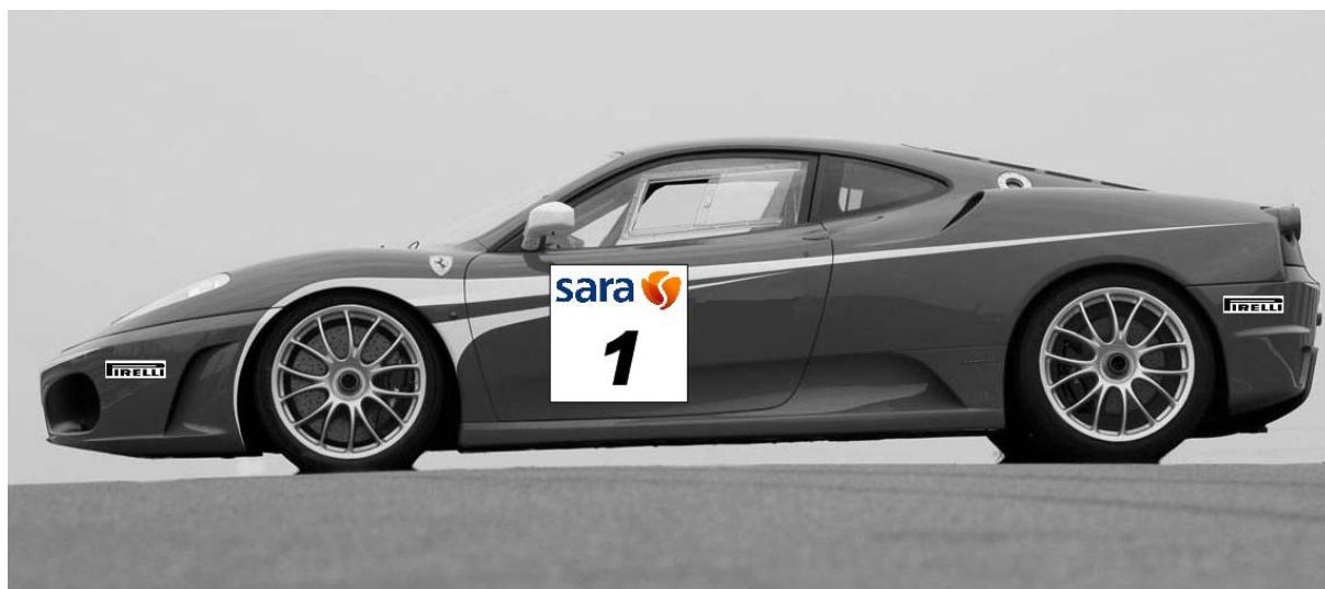
Disegno n° 1: Placca Portanumero e adesivi su paraurti : modalità di applicazione